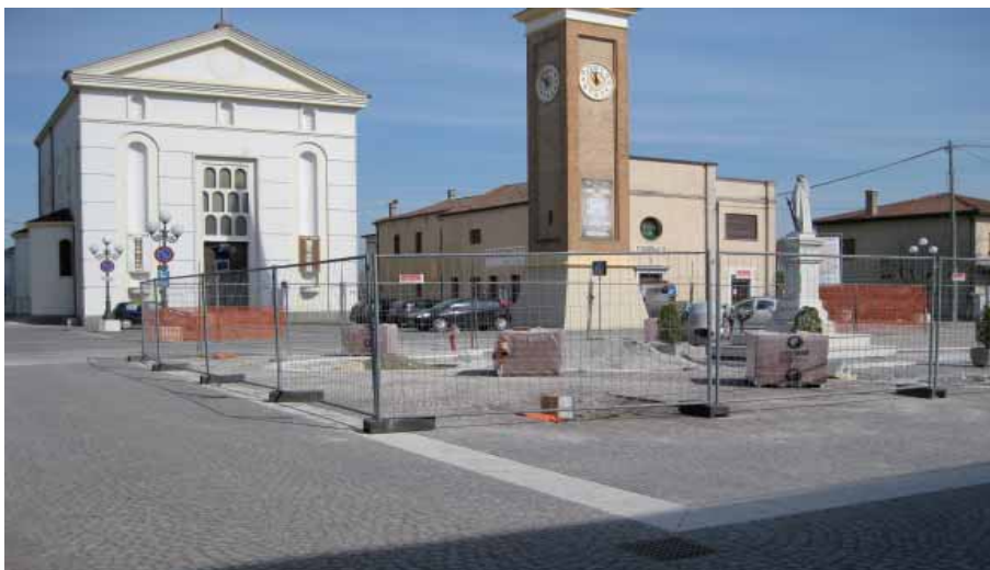
Sopra: percorsi pedonali e piazza di Vetrego.

E' previsto per maggio il completamento dei lavori di sistemazione e arredo urbano del centro di Vetrego che comporteranno una spesa di circa € 1.111.000,00. L'intervento verrà ulteriormente arricchito con i lavori di completa sostituzione dell'impianto