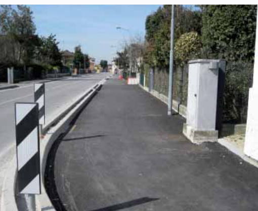
Pista ciclabile di via Caltana

Sono in avanzato stato di realizzazione i lavori per la nuova pista ciclabile sul lato nord di via Caltana, diretti dall'Ufficio Tecnico Comunale. Il completamento del Passante consentirà l'ultimazione della pista in corrispondenza dell'intersezione con il medesimo, garantendo quindi il collegamento tra il centro di Scaltenigo e la pista ciclabile lungo via Porara che, con lavori a carico del Commissario Delegato per il Passante, è stata a sua volta completata con il collegamento con la frazione di Vetrego. Tutti i lavori saranno completati entro l'estate 2009 con una spesa complessiva di € 1.800.000,00 che beneficerà di un contributo da parte della Provincia di Venezia.