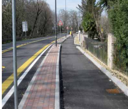
Pista ciclabile di via Parauro

Risultano in fase di consegna anche i lavori di adeguamento ed ampliamento degli impianti di illuminazione pubblica in via Accopè Fratte e in via Desman assegnati alla ditta Dervit di Roccadaspide (SA) che comporteranno una spesa complessiva di € 300.000,00. Entrambi gli interventi sono diretti dall'Ufficio Tecnico Comunale.