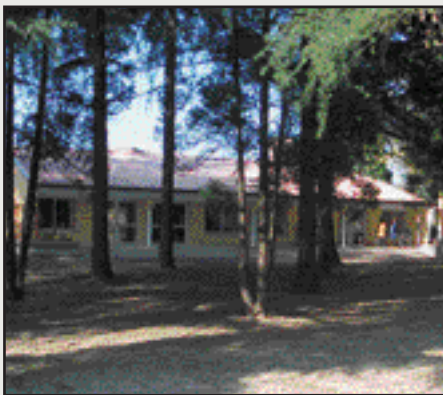
Scuola materna "Zanetti Meneghini"

barchessa di Villa Bianchini. L'investimento complessivo per l'Amministrazione comunale (acquisto immobile, lavori e nuovo arredo) ammonterà, a conclusione degli interventi, a circa € 1.250.000.