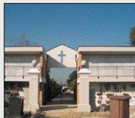
Cimitero di Ballò

Entro quest'anno l'A.C.M. procederà inoltre all'appalto del 30° lotto dei lavori di fognatura nera del Comune come concordato con l'Amministrazione comunale. Interesseranno una vasta area del Capoluogo sud-ovest compresa tra le vie Gramsci, Firenze, Torino, Cavin di Sala per un importo complessivo di € 733.370.